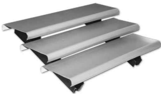
SUNSCREEN dengan stringer SL2