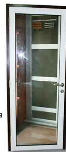
Pintu Panel Kaca