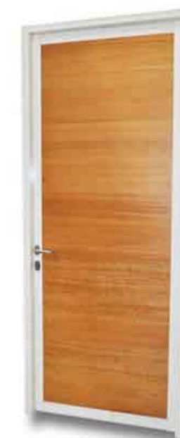
Pintu bahan Gypsum dan Finish Thickwood